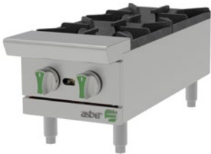
AEHP 2 12 EM

Kit de patas tubulares en acero inoxidable regulables en altura de 4" a 6".