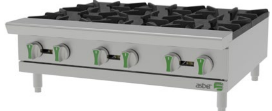
AEHP 6 36 EM