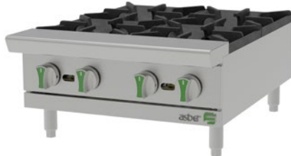
AEHP 4 24 EM