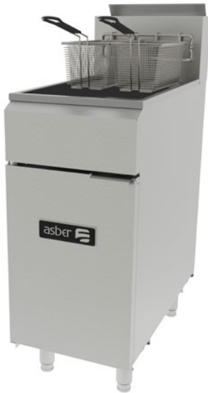
AEF 50 S

Kit de ruedas de 5" de diámetro (altura máxima de 6" con vástago incluido), de las cuales las 2 frontales llevan freno (con costo adicional).