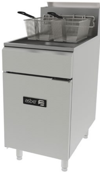
AEF 75 S