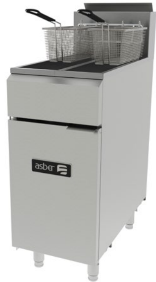
AEF 2525 S