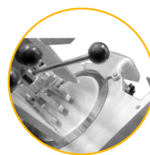
Cuchilla de acero 100Cr6