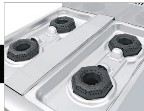
Cubierta semi-sellada para evitar derrames al interior.

Disponibles en tres diferentes versiones: