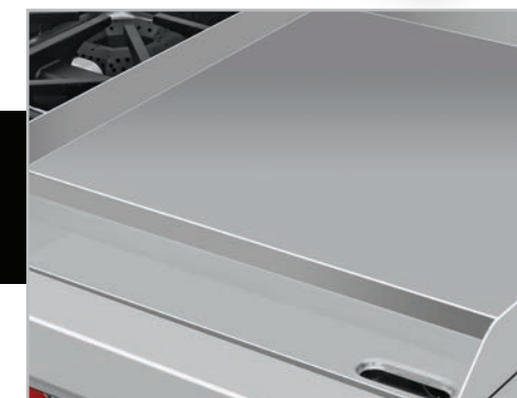
Plancha con exclusivo sistema recolector de grasa y residuos.