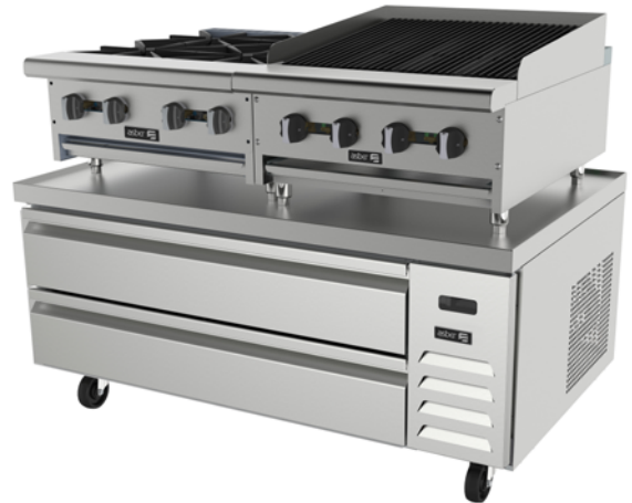
ACBR-52 HC + AEHP-4-24 + AERB-24

IMPORTANTE: los equipos de "Cocción de Sobremesa" a ubicar sobre las Bases de Chef Refrigeradas deberán incluir las patas, las cuales deberán adquirirse con el fabricante. El espacio mínimo requerido entre la base de los equipos de "Cocción de Sobremesa" y la parte superior de las cubiertas de las Bases de Chef Refrigeradas debe ser de al menos 4". El incumplimiento de lo citado elimina la garantía otorgada por parte de ONNERA MEXICO.